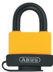
70AL ARCO 25mm