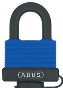
70IB ARCO 25mm